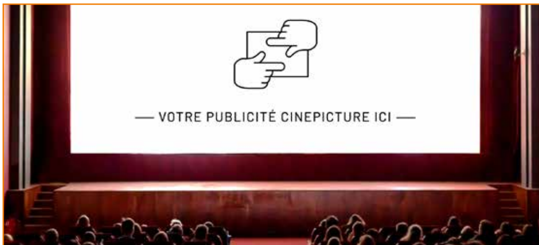
IMAGE FIXE DIFFUSÉE DURANT 7 SECONDES SANS LE SON