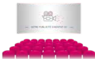
Annonces sur grand écran