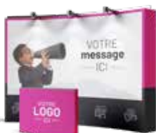
Supports imprimés pour événements

CONSEILS SUR-MESURE VISIBILITÉ OPTIMALE SUPPORTS DE COMMUNICATION PERTINENTS