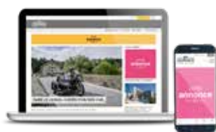
Annonces en ligne