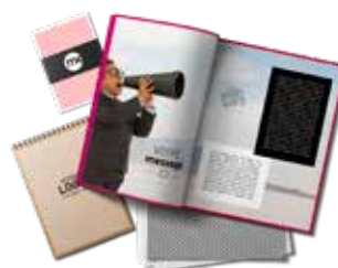
Impressions tous supports