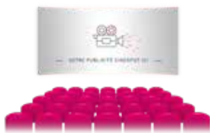
Annonces sur grand écran