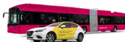
Marquage de véhicules et vente d'emplacements