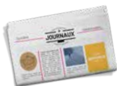
Annonces dans la presse fribourgeoise

Quel que soit la situation vous avez le bon canal de diffusion pour votre message.