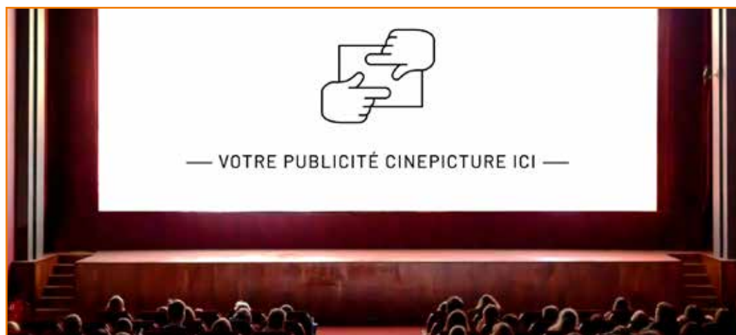
IMAGE FIXE DIFFUSÉE DURANT 7 SECONDES SANS LE SON