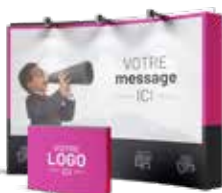
Supports imprimés pour événements

CONSEILS SUR-MESURE VISIBILITÉ OPTIMALE SUPPORTS DE COMMUNICATION PERTINENTS